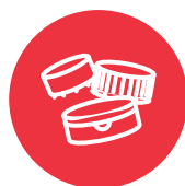
瓶子、罐子和 容器的蓋子