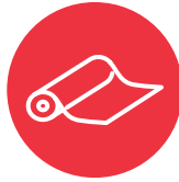
Me'a kofukofu me'akaí