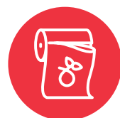
Ngaahi kato 'oku lava ke fakapalanga

Toki fa'o pē 'a e toetoenga me'akaí 'i ho'o pini fa'o'anga toetoenga me'akaí. 'Oku fulihi 'a e toetoenga me'akaí ki ha ngaahi koloa 'oku lava ke nau fakalelei'i hotau kekelé. 'Oku tokoni eni ke tau tō ai ha ngaahi fua'i'akau mo e vesitapolo 'oku mo'ui lelei.