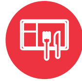
Ko e ngaahi me'a kofukofu mo e fa'o'anga me'a 'oku lava ke fakapalanga