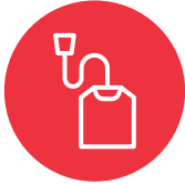
Fanga ki'i tangai tíí