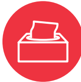
Ngaahi pepa holo matá (tissues)