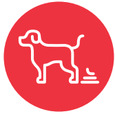
Te'emanu 'o e monumanu tauhí