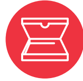
Ngaahi puha pisá (pizza boxes)