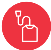
Ngā pēke tī