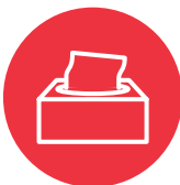
Ngā pepa rauangi