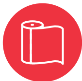
Ngā taora pepa