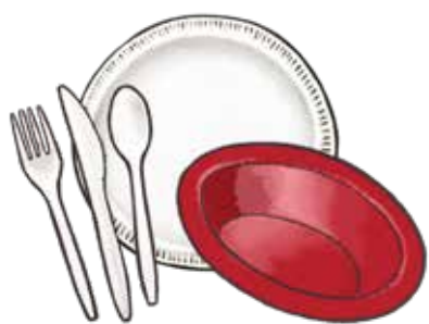
塑膠餐具 ( 盤子，碗和餐具 )