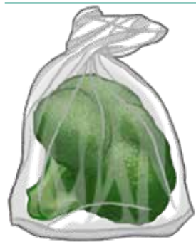
用於包裝新鮮水果和蔬菜 的農產品塑膠袋▲