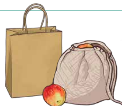
Beg guna semula atau beg kertas, atau tiada beg