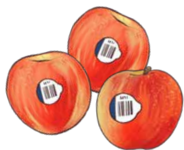
Label plastik untuk buah-buahan dan sayur-sayuran (fasa keluar bermula)