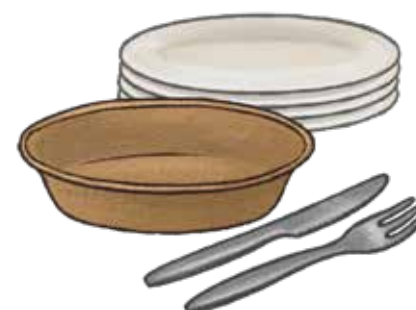
Pinggan mangkuk kertas atau yang boleh digunakan semula