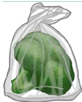
Beg plastik yang digunakan untuk membungkus buah-buahan dan sayur-sayuran segar ▲