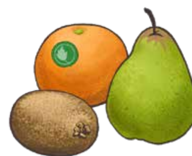
Hasil tanpa label atau label boleh kompos di rumah menjelang pertengahan 2025